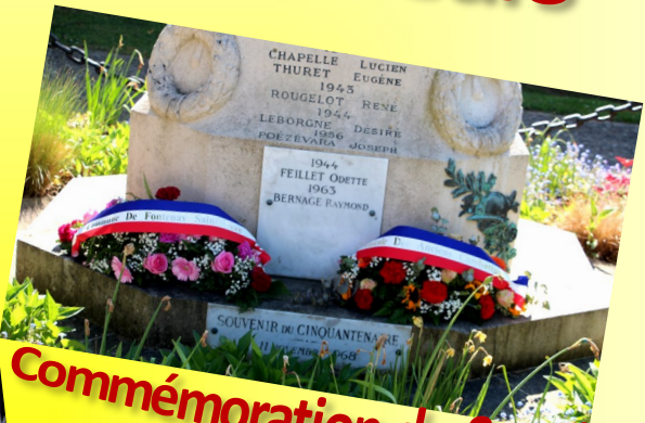
Commemoration du 8 mai 1945