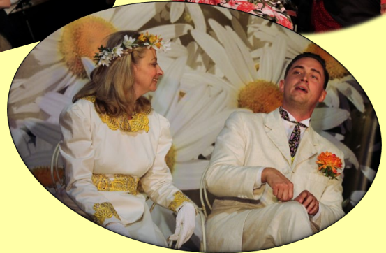
Sortie CCAS à Forges les eaux