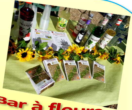
Bar à fleurs