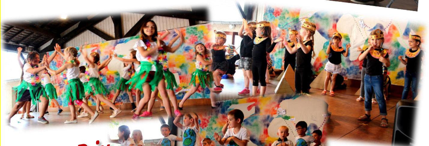
Fête des Prix