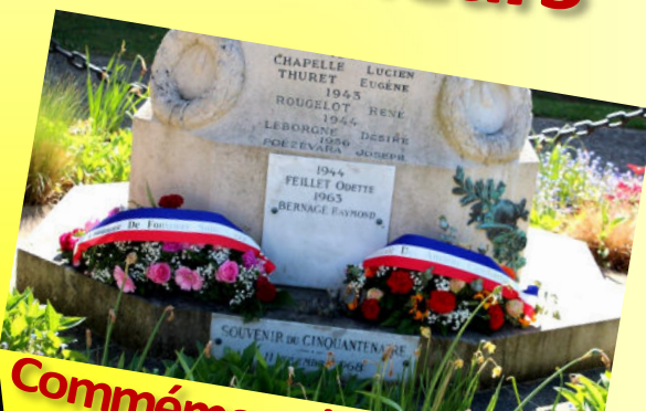
Comméoration du 8 mai 1945