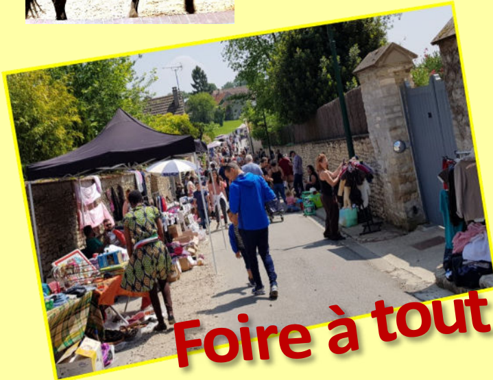
Foire à tout