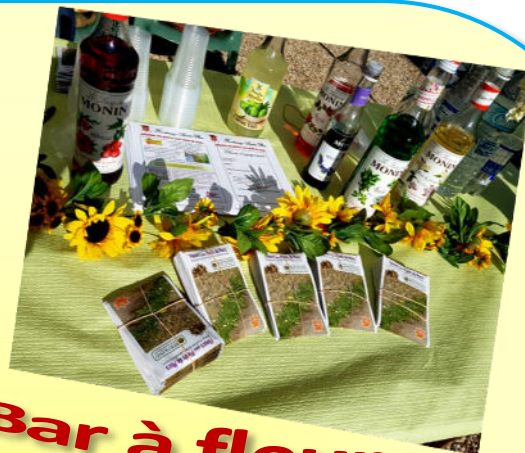
Bar à fleurs