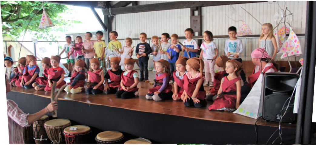
Fête du péri-éducatif