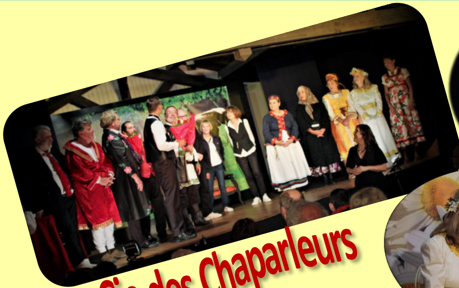
La Cie des Chaparleurs