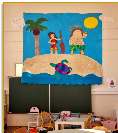
Dessin animé : Vaïana

A la garderie , les enfants restent également groupés avec ceux de leurs classes respectives.