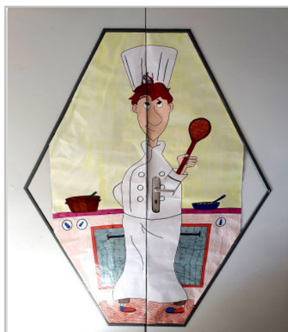
Dessin animé : Ratatouille (Linguini)