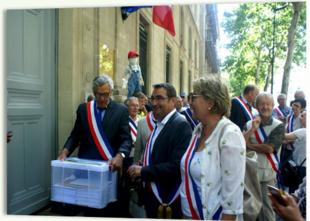
RDV au Ministère de l'écologie des Maires de la Zone 109 et autres élus

Reportage réalisé par FR3 à consulter sur le site de la commune https://www.fontenay-saint-pere.fr/reportage-fr3-contre-les-carrieres/