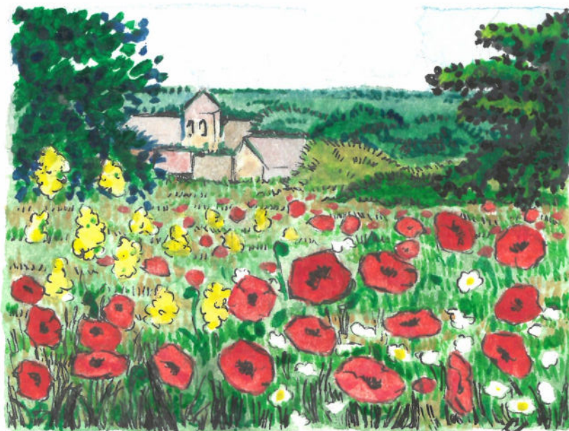
L'été, vue de la rue des prés

Dans cette nouvelle édition du : Fil de Fontenay