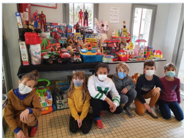
Collecte de jouets au profit des enfants défavorisés du Secours Populaire.