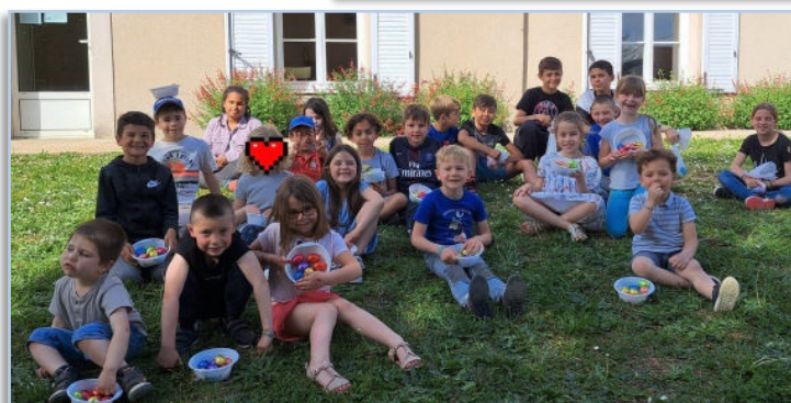
Chasse aux œufs de Pâques !