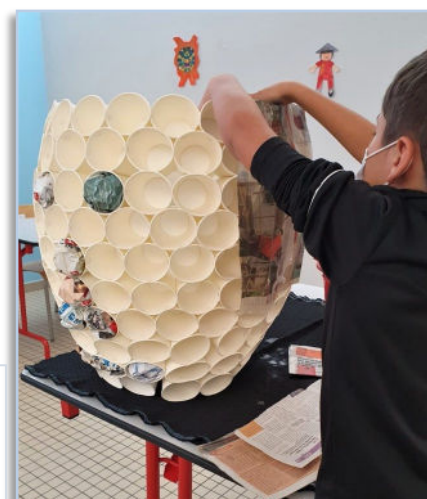
Confection de la tête de M. CARNAVAL Tous les enfants ont mis la main à la pâte!

Nos animatrices du temps périscolaire ont du talent ! Leur savoir-faire et leur créativité tout au long de l'année scolaire permettent aux enfants d'avoir accès à des activités ludiques et originales.