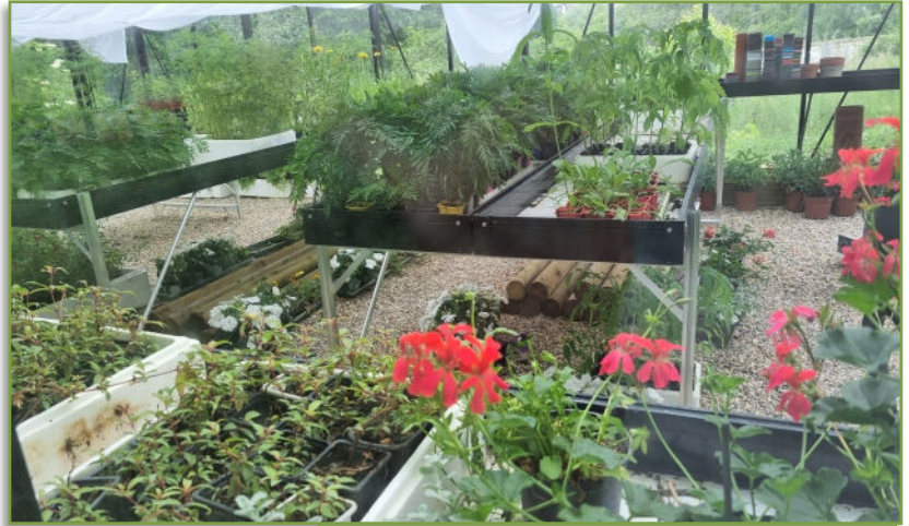
La serre communale au Clos des Tilleuls.

De nouvelles jardinières de fleurs sont installées à la Corvée et autres petits coins du village; d'autres en bois, remplaceront, prochainement, celles de la Place de la Mairie.